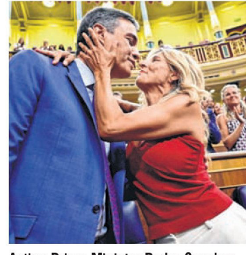
Acting Prime Minister Pedro Sanchez and Deputy Yolanda Diaz in Parlia-

It was first parliamentary vote since inconclusive national elections on July 23 left no group